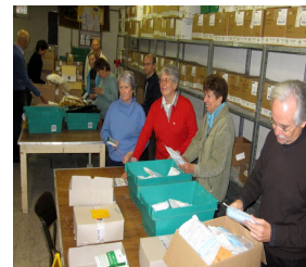
Les bénévoles en action au centre de tri

Activité quart-monde : Notre action, en 2011, a concerné les associations quart-monde, situées à Toulon ou dans ses environs. Don de : compresses, couches pansements, lunettes .., matériel Médical, pour les adultes, Don de : lait maternisé, couches, compresses, tétines...pour les associations d'enfants telle que Bébé Bonheur Toulon et La Garde.