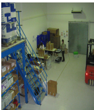
L'accès aux soins pour les plus démunis.

Le demandeur doit fournir à l'Etablissement Pharmaceutique de PHI :